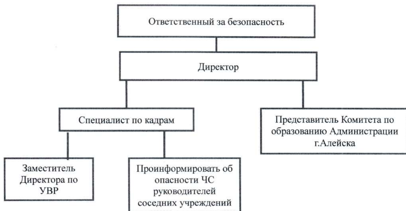
Схема оповещения и связи при ЧС